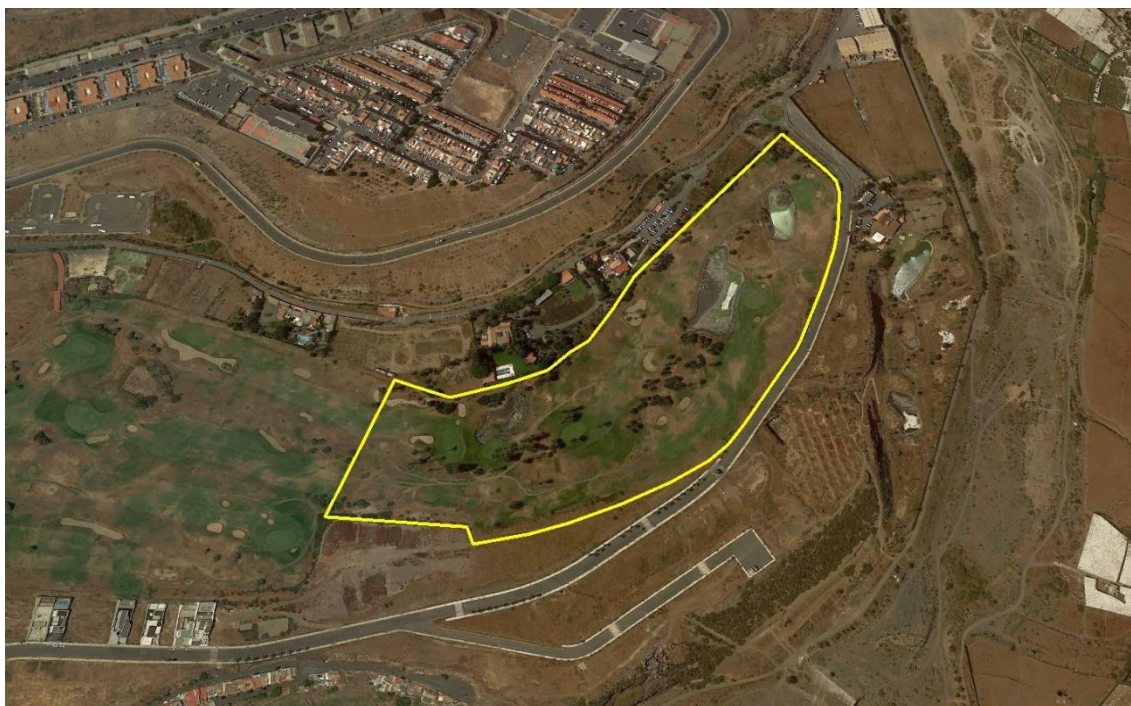
Ortoimagen general ámbito de estudio de El Cortijo (Telde)

El ámbito del Proyecto es la zona de El Cortijo de San Ignacio, que se inserta próximo a la costa, en el término municipal de Telde, ocupando parte de las instalaciones del campo de golf preexistente, que en la actualidad se halla sin uso y sin mantenimiento.