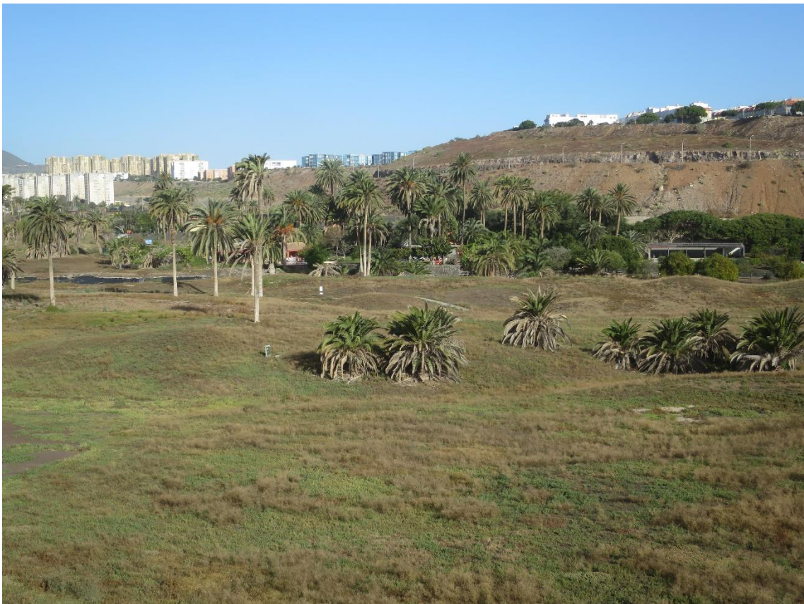
Fotos 13-14 Panorámicas del estado actual del ámbito de estudio en El Cortijo