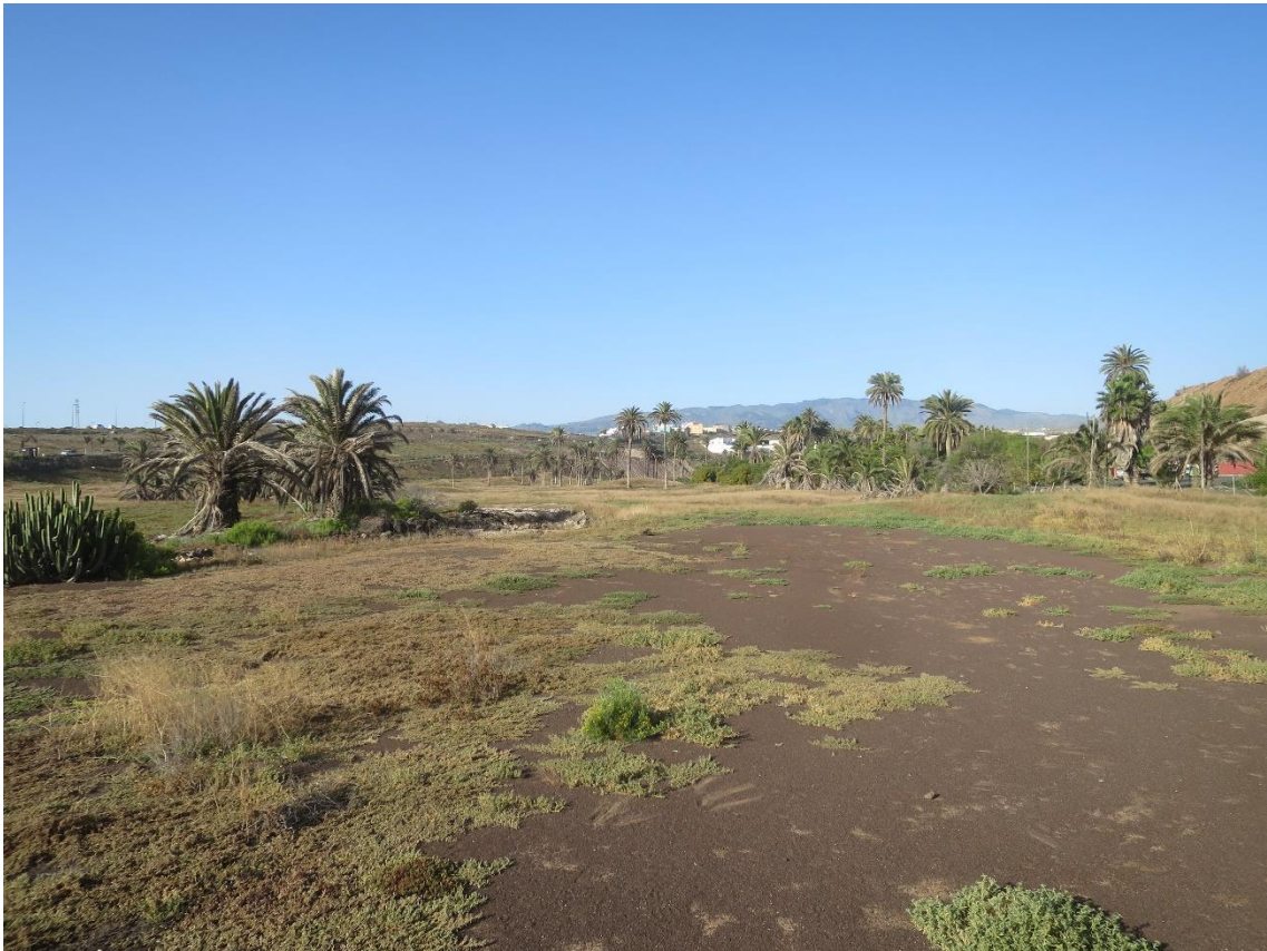
Fotos 7-8 Panorámicas del estado actual del ámbito de estudio en El Cortijo