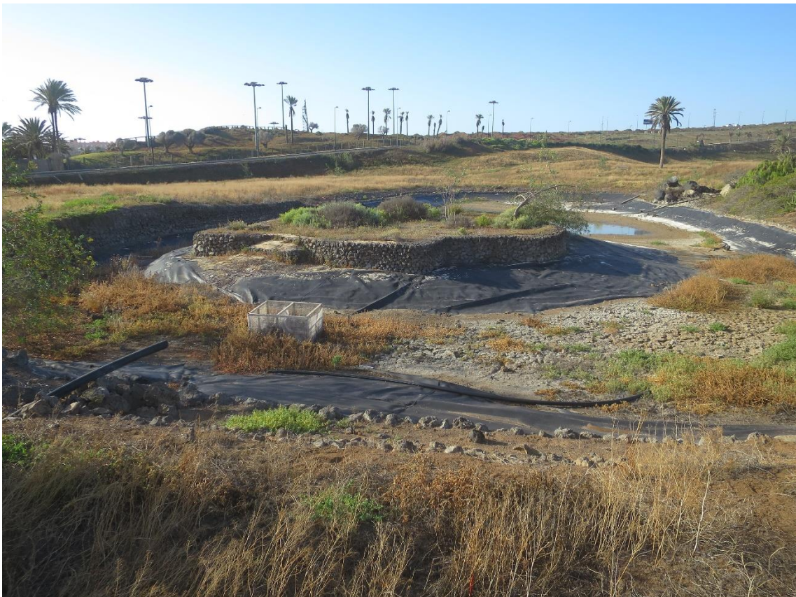
Fotos 5-6 Panorámicas del estado actual del ámbito de estudio en El Cortijo