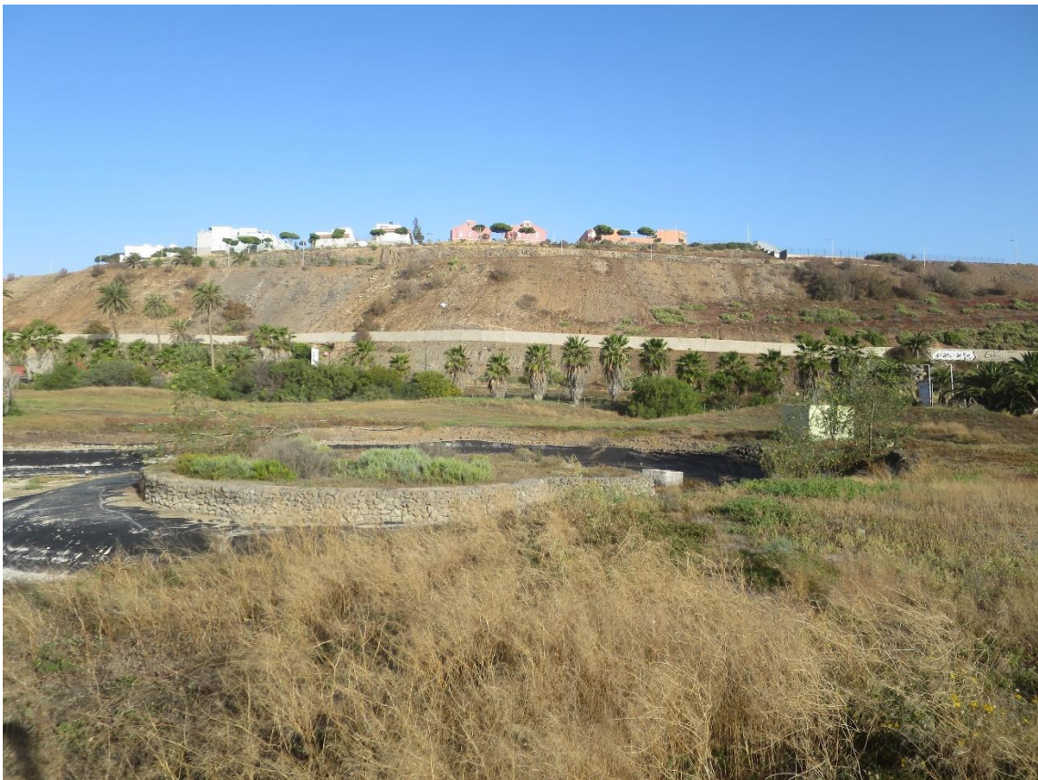
Fotos 3-4 Panorámicas del estado actual del ámbito de estudio en El Cortijo