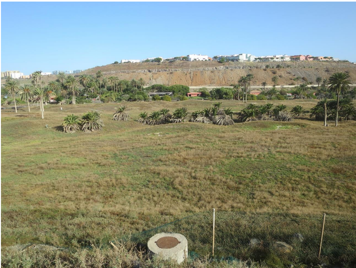
Fotos 11-12 Panorámicas del estado actual del ámbito de estudio en El Cortijo