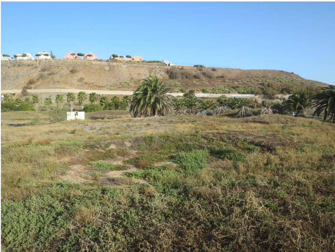
Fotos 1-2 Panorámicas del estado actual del ámbito de estudio en El Cortijo