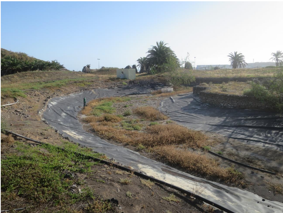
Fotos 9-10 Panorámicas del estado actual del ámbito de estudio en El Cortijo